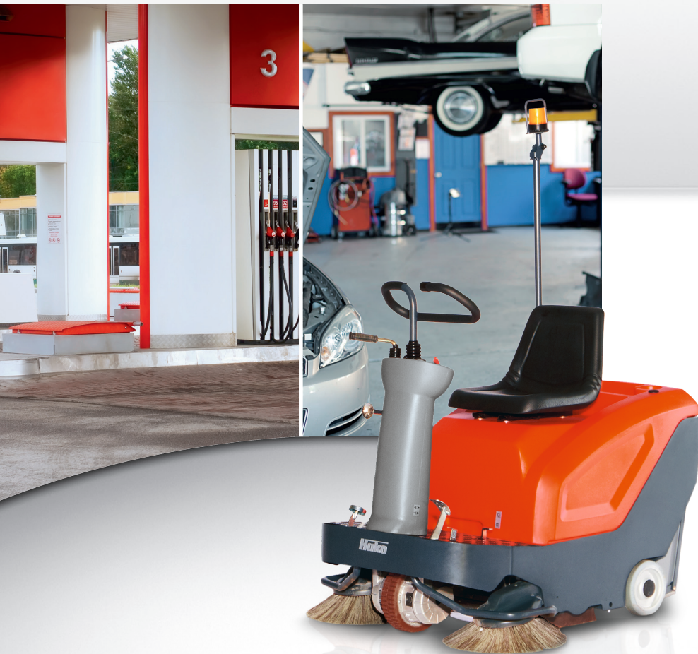
Sweepmaster B800 R